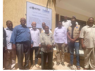
احتفالية انتهاء أعمال إعادة التأهيل بمدرسة عرب الصحراء.

في 30 أغسطس، أقيمت احتفالية بمناسبة انتهاء أعمال إعادة التأهيل بمدرسة عرب الصحراء الابتدائية ببلدية بنت بية جنوب ليبيا، والتي يدرس بها طلبة ليبيون وغير ليبيين. أشرفت منظمة أكتد - شريك المفوضية - على أعمال إعادة التأهيل التي شملت الحمامات والأبواب والنوافذ وتركيب شبكة كهرباء جديدة، بالإضافة إلى إعادة طلاء المبنى. تهدف المشاريع سريعة التأثير، مثل هذا المشروع، إلى تحسين الوصول إلى الخدمات المحلية وتعزيز التعايش السلمي في المناطق التي تستضيف نازحين ليبيين ولاجئين وطالبي لجوء.