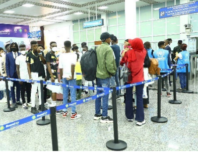
موظف المفوضية وهم يساعدون طالبي اللجوء عقب وصولهم إلى رواندا.

في 31 أغسطس، تم إجلاء 101 من طالبي اللجوء، ضمنهم 22 امرأة و38 طفلاً، حيث نقلوا من ليبيا إلى بر الأمان في رواندا. سوف يتحصلون على المأوى والمساعدة في آلية عبور الطوارئ في غاشورا. في 5 سبتمبر، أعيد توطين 33 لاجئاً، ضمنهم عشر نساء و15 طفلاً، حيث نقلوا من ليبيا إلى أوروبا. منذ سنة 2017، غادر ليبيا 8,919 لاجئاً وطالب لجوء على متن رحلات إعادة توطين وإجلاء مباشرة، وعبر المسارات التكميلية بما فيها التأشيرات الإنسانية ولم شمل العائلات. المفوضية ممتنة للسلطات الليبية على دعمها في تسهيل الإجراءات اللازمة لرحلات الإجلاء الإنساني، كما أنها مستمرة في حث الدول على توفير المزيد من المسارات القانونية لمساعدة بعض أكثر الأشخاص ضعفاً على الوصول إلى بر الأمان خارج ليبيا.