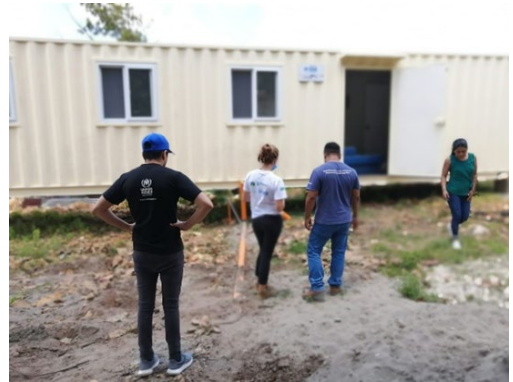
Casa Migrante Belén en la comunidad fronteriza de El Ceibo.