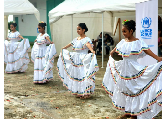
Baile folklórico en la conmemoración del Día Mundial del Refugiado en Flores.