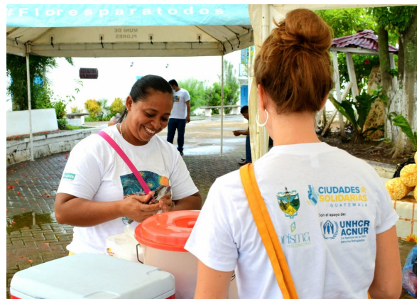
Feria cultural en Flores, Petén por el Día Mundial del Refugiado.