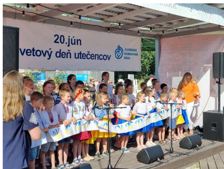
Deti na podujatí Svetového dňa utečencov v Bratislave.