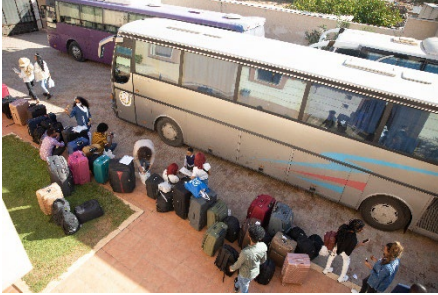
طالبو اللجوء في طريقهم إلى المطار.

في 29 سبتمبر، أجلت المفوضية 179 طالب لجوء حيث نقلوا من ليبيا إلى بر الأمان في النيجر، وكانت هذه هي أول رحلة من نوعها إلى النيجر في هذا العام. ضمت المجموعة 60 امرأة و21 طفلاً، ولقد استقبلوا في آلية عبور الطوارئ في النيجر والتي أنشأتها حكومة النيجر في عام 2017 لاستقبال طالبي اللجوء واللاجئين الذين يواجهون أوضاعاً تهدد حياتهم في ليبيا ريثما تحاول المفوضية تحديد حلول دائمة لهم. منذ 2017، تم إجلاء 3,846 شخص إلى النيجر.