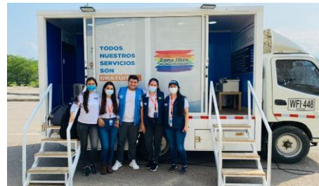
Equipo de la Unidad Móvil PAO en campaña masiva en Arauca

ACNUR, a través de su socio implementador Corporación Opción Legal , cuenta con 52 Puntos de Atención y Orientación (PAOs) en Colombia, los cuales amplían el alcance de ACNUR en 19 departamentos y 37 municipios. Los PAOs brindan un espacio seguro para que las personas a las que ACNUR sirve reciban atención y orientación, también permiten al ACNUR identificar y responder a necesidades específicas de protección (NEPs). La mayoría de los PAOs son fijos y tienen ubicaciones estratégicas (ej. Terminales de bus, puntos oficiales de entrada en la frontera). Además, ACNUR cuenta con 3 PAOs móviles para llegar a lugares de difícil acceso. Durante el primer semestre de 2022, los PAOs registraron alrededor 19.000 personas a través 44.142 comunicaciones y brindaron 6.046 asistencias y 3.919 referencias para servicios especiales de protección .