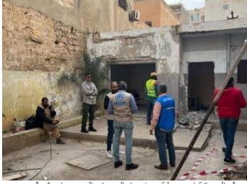
عمال الصيانة في محطة ضخ مياه الصرف الصحي في شمال بنغازي

شرع شريك المفوضية، المجلس النرويجي للاجئين، في أعمال إصلاح محطة ضخ مياه الصرف الصحي في شمال بنغازي. تنقل محطة الضخ مياه الصرف الصحي، وسيخدم هذا المشروع منطقة سيدي حسين التي يقطنها حوالي 14,000 شخص ضمنهم لاجئون وكثيرون ممن عادوا بعد النزاع في بنغازي في عام 2017. يأتي هذا المشروع في إطار الجهود المبذولة لإعادة تأهيل البنية التحتية الأساسية في المناطق التي تضررت من النزاع. وستشمل الأعمال أعمالاً إنشائية وأعمال سباكة وبلاط وكهرباء.