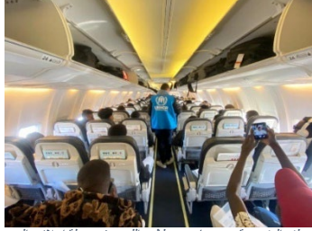
موظف مفوضية وهم يساعدون طالبي اللجوء في رحلة إجلائهم إلى إيطاليا.

في 1 ديسمبر، بالتعاون مع الشريك لجنة الإنقاذ الدولية، نظمت مفوضية اللاجئين فعالية في المساحة الأمانة للنساء والفتيات وذلك في إطار فعاليات 16 يوماً من الأنشطة. جمعت الفعالية نساء لاجئات من خلفيات مختلفة، ولقد انخرطن في حوار حول الأشكال المختلفة للعنف القائم على نوع الجنس وتعزيز صمود النساء. بالإضافة إلى ذلك، وحيث إن 1 ديسمبر هو اليوم العالمي للإيدز، فقد نُفذت حملة توعية حول الصحة الجنسية والإنجابية.