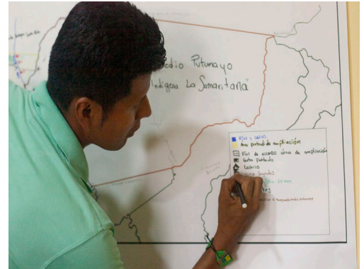
Jornada de trabajo con las comunidades-caracterización social. 2022.