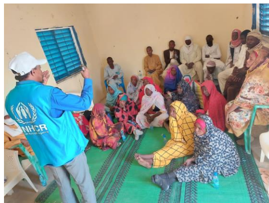
Séance d'échange avec un groupe de leaders réfugiés camerounais à Guilmeiy sur la paix et la réconciliation, @UNHCR février 2023

Un remerciement spécial à nos principaux bailleurs en 2023 : Japon | Suisse | Espagne | Suède | Canada | Tchad | Royaume-Uni | Allemagne | Programme des Nations Unies sur le VIH/SIDA | Union Européenne | Divers Bailleurs Privés