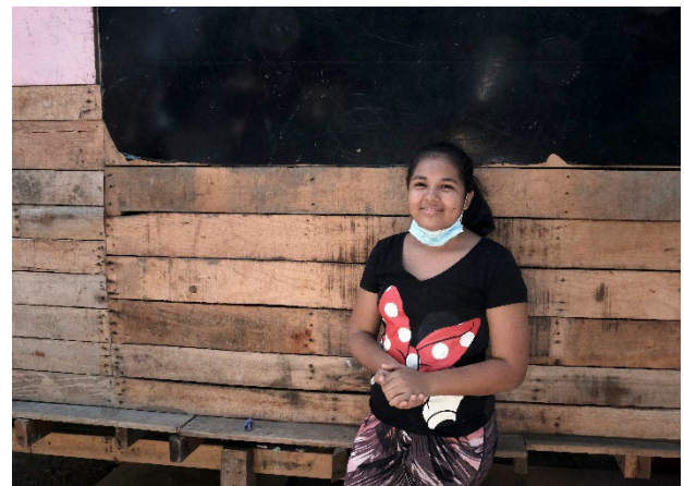
Junto a su madre y hermana, esta joven nicaragüense solicitó refugio en Panamá. Actualmente buscan reconstruir sus vidas, dedicándose a la venta de comida y pan.