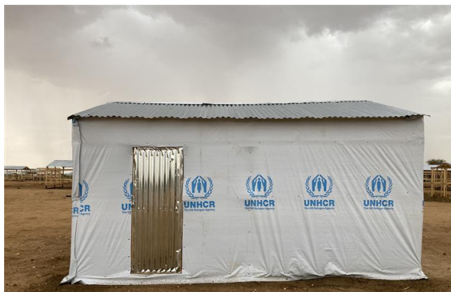
Un modèle d'abri en construction sur le site de Gaga, 12 mai 2023