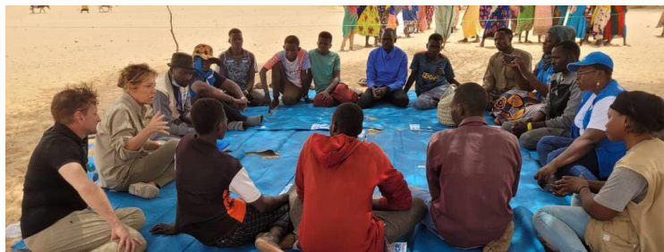
Mission ECW à Borota, groupe de discussion avec de jeunes réfugiés soudanais le

Education Cannot Wait (ECW) a annoncé une subvention de trois millions de dollars lors d'une mission au Tchad. Les résultats des entretiens de suivi de protection auprès de 800 nouveaux ménages soudanais ont indiqué que 55% des ménages avaient des enfants en âge d'être scolarisés et 81% des ménages avaient des enfants qui allaient à l'école au Soudan. Ce financement ECW permettra donc aux enfants réfugiés d'accéder aux environnements d'apprentissage sûrs, et soutiendra les communautés d'accueil. Cette subvention porte le total des investissements d'ECW au Tchad à plus de 41 millions de dollars.