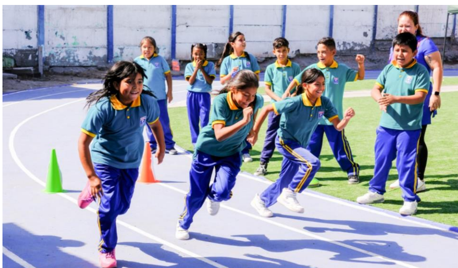
Promoviendo el bienestar y desarrollo de los niños del Colegio América en Arica (región de Arica y Parinacota), a través de la inauguración de una mini cancha deportiva, donde interactúan familias chilenas, refugiadas y migrantes.