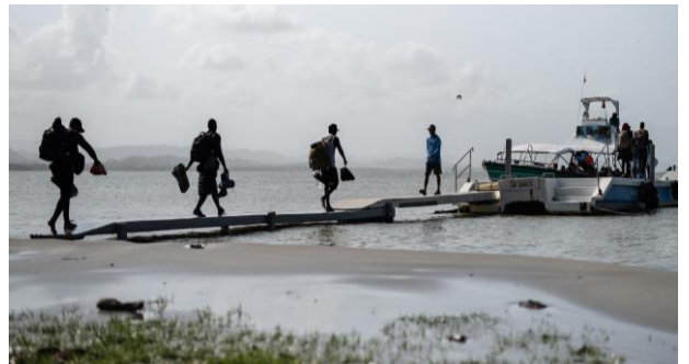
Personas refugiadas en tránsito saliendo de Necoclí hacia Acandí.