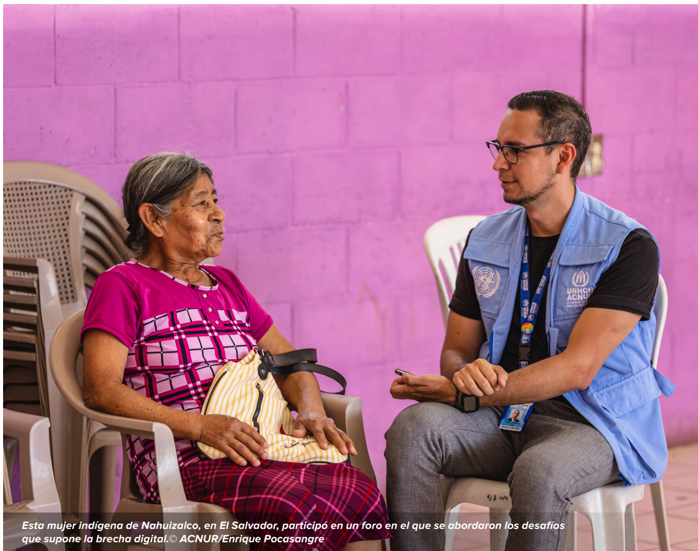
Esta mujer indígena de Nahuizalco, en El Salvador, participó en un foro en el que se abordaron los desafíos que supone la brecha digital.

La falta de recursos impedirá que 745 personas desplazadas por la fuerza tengan acceso a programas de medios de vida, como educación para personas LGBTIQ+ en edad adulta, oportunidades laborales, formación técnica y vocacional, y capital semilla para emprendimientos de personas desplazadas por la fuerza. Se requieren con urgencia más recursos para que ACNUR pueda ampliar las oportunidades e impulsar soluciones para evitar que haya aún más desplazamientos en El Salvador.