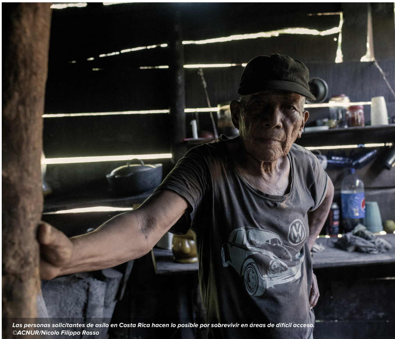
Las personas solicitantes de asilo en Costa Rica hacen lo posible por sobrevivir en áreas de difícil acceso.

La eficiencia del actual sistema de asilo se ha visto mermada por el aumento considerable de nuevas solicitudes de asilo en años recientes y por la inexistencia de herramientas o de una base de datos oficial para gestionar el procedimiento de determinación de la condición de refugiado. En este momento, el rezago supera los 240.000 casos de personas que aguardan una resolución. Mientras tanto, el retraso en la presentación de documentación continúa obstaculizando el acceso al empleo. Por otra parte, si bien Costa Rica ofrece atención médica gratuita en casos de emergencia —incluso para niñas y niños, así como mujeres o personas embarazadas o lactantes—, muchas personas refugiadas y solicitantes de asilo padecen enfermedades crónicas o graves que requieren atención médica regular. De no contar con fondos adicionales, más de 4.000 personas en grave situación de vulnerabilidad , tanto refugiadas como solicitantes de asilo, no tendrán acceso a la atención médica que necesitan.