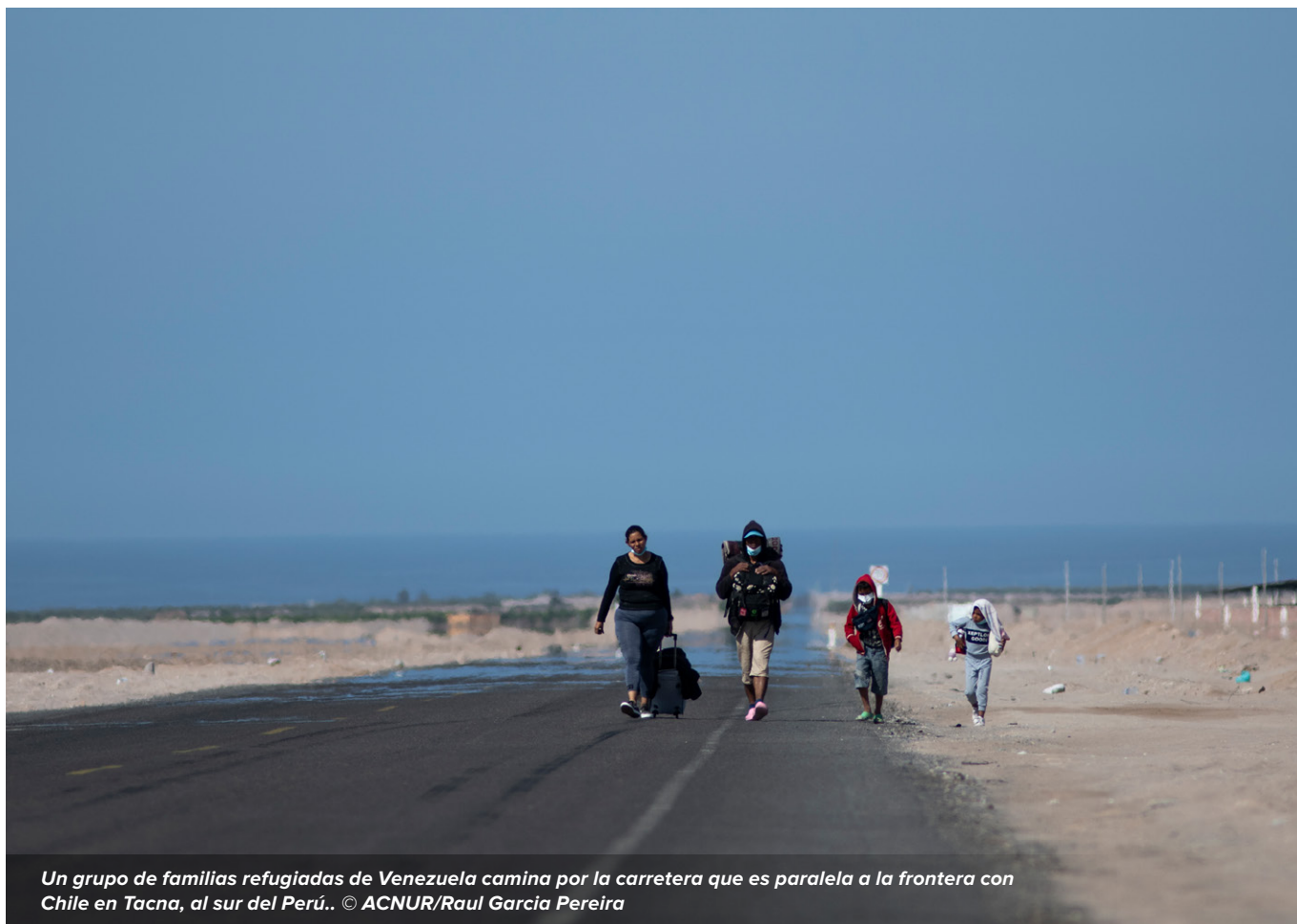
Un grupo de familias refugiadas de Venezuela camina por la carretera que es paralela a la frontera con Chile en Tacna, al sur del Perú..

Debido a las duras condiciones climáticas en el corredor andino, ACNUR proporciona a las personas desplazadas por la fuerza artículos básicos de ayuda, como prendas abrigadoras, mantas, artículos de higiene, medicamentos y kits de primeros auxilios. De continuar la falta de fondos, 2.800 personas desplazadas por la fuerza en Argentina, Bolivia, Chile, Paraguay y Uruguay no recibirán los artículos básicos de ayuda que les permitirían satisfacer sus necesidades básicas más apremiantes. ACNUR también necesita fondos para la identificación de las personas en situación de movilidad humana, así como brindar servicios y asesoramiento jurídico a más de 18.000 personas desplazadas por la fuerza o en riesgo de apatridia.