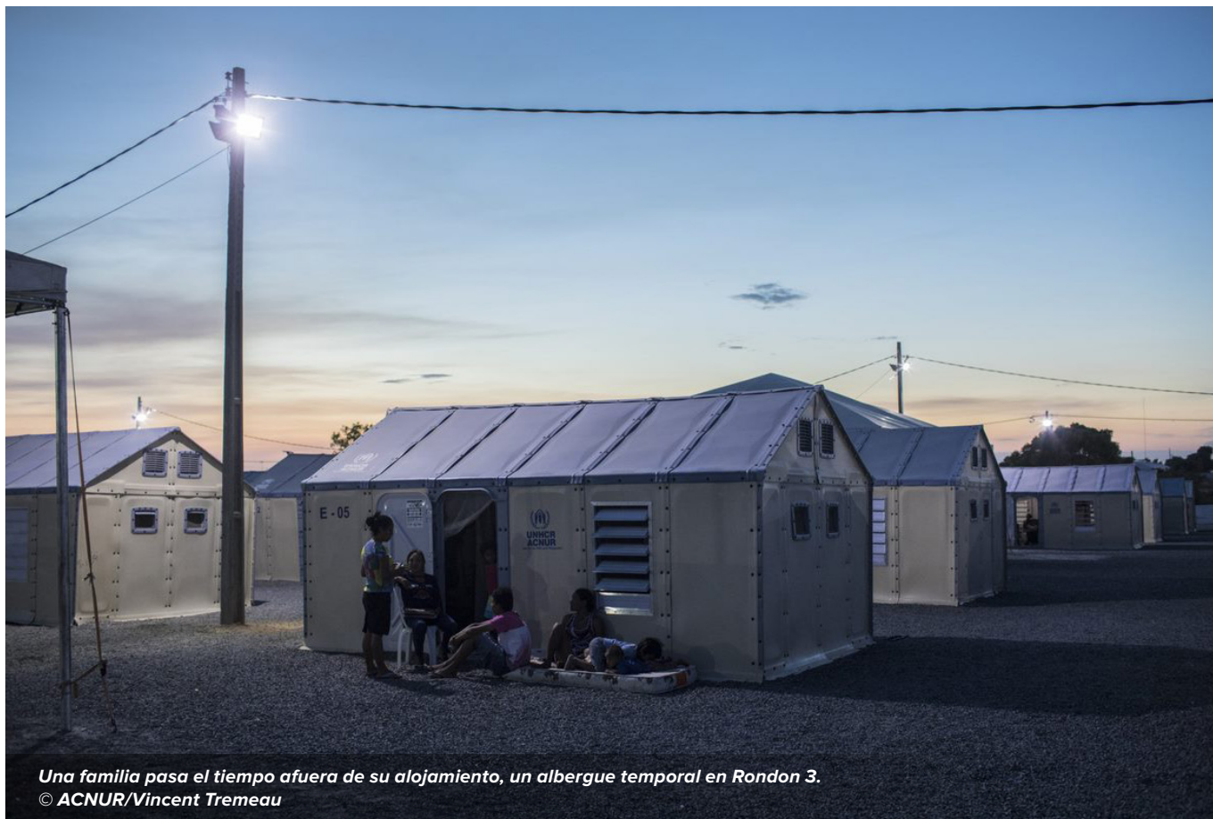
Una familia pasa el tiempo afuera de su alojamiento, un albergue temporal en Rondon 3.

En situaciones de emergencia, las familias huyen apenas con las prendas que llevan puestas; es decir, el desplazamiento las despoja de sus pertenencias. Además de alimentos, su supervivencia depende de artículos básicos de ayuda, que incluyen albergue (tiendas de campaña, lonas de plástico, mantas y colchonetas), utensilios para cocinas (estufas, cazuelas, combustible), y atención médica y saneamiento (jabones, bidones, toallas sanitarias, baldes). En estos contextos, la ayuda en efectivo constituye un componente esencial de las intervenciones de protección para brindar asistencia a las personas en mayor situación de vulnerabilidad; asimismo, ofrece a los desplazados por la fuerza tanta dignidad, flexibilidad y facilidad como es posible para que puedan satisfacer sus necesidades y ampliar sus capacidades. Se requiere mucho más apoyo para garantizar que alrededor de 20.000 personas puedan cubrir sus necesidades básicas.