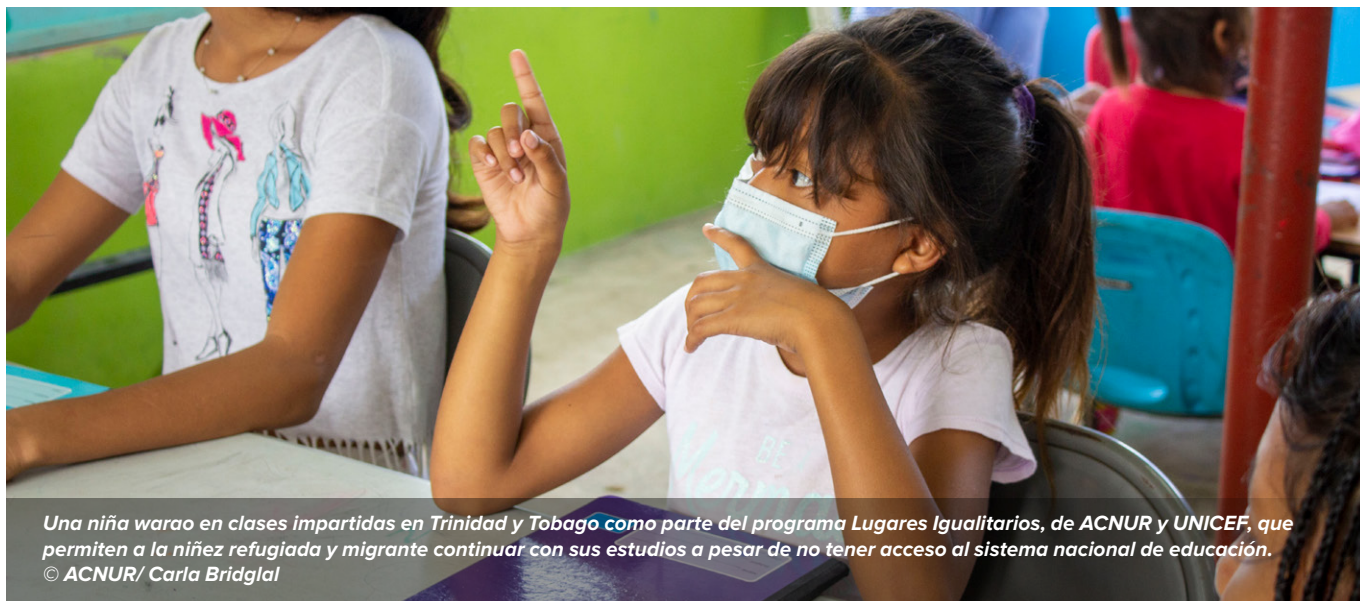
Una niña warao en clases impartidas en Trinidad y Tobago como parte del programa Lugares Igualitarios, de ACNUR y UNICEF, que permiten a la niñez refugiada y migrante continuar con sus estudios a pesar de no tener acceso al sistema nacional de educación.

Si ACNUR no logra recibir, por lo menos, una financiación adicional de USD 480.000, más de 2.100 niñas y niños no podrán asistir a la escuela primaria o secundaria, y más de 1.000 personas en situación de vulnerabilidad no recibirán la atención médica que necesitan. De manera similar, sin estos recursos adicionales, más de 400 sobrevivientes de violencia de género no recibirán asistencia, es decir, albergue, gestión de su caso y apoyo psicosocial.