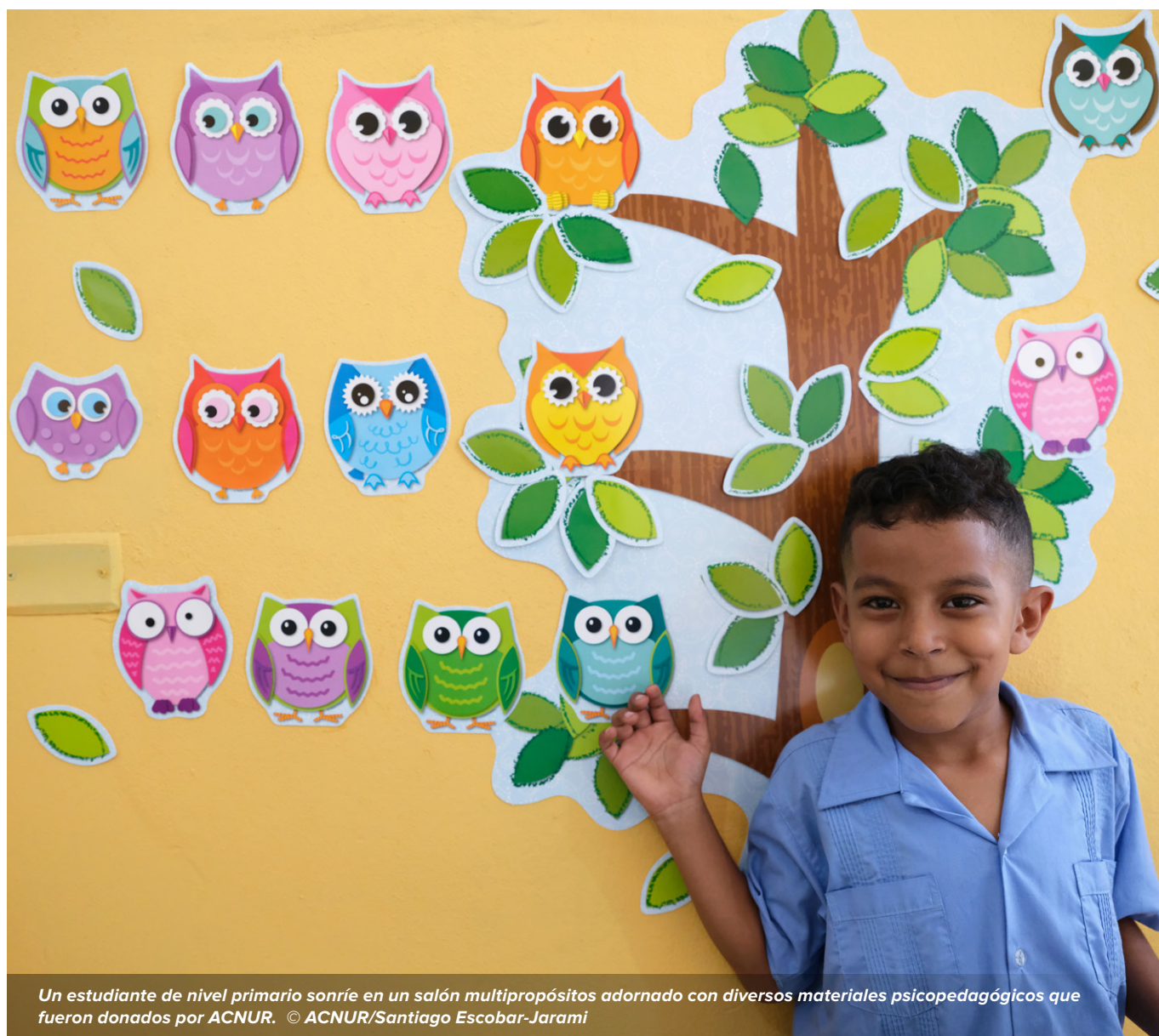
Un estudiante de nivel primario sonríe en un salón multipropósitos adornado con diversos materiales psicopedagógicos que fueron donados por ACNUR.

ACNUR ofrece atención mental y apoyo psicosocial, albergue, reubicación, asesoramiento jurídico y protección comunitaria. Sin embargo, de no recibir fondos adicionales, más de 55.000 personas desplazadas internas, retornadas y otras en movimientos mixtos quedarán expuestas a mayores riesgos y estarán en situación de vulnerabilidad debido a la violencia generalizada en el país. Por otra parte, la incidencia frente a instituciones gubernamentales y el apoyo —incluido el técnico— que estas reciben resultan esenciales para garantizar la aplicación de la Ley de prevención, atención y protección de las personas desplazadas internamente, de reciente aprobación, que en Honduras constituye el marco de protección de esta población.