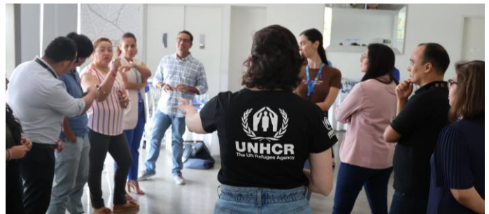
Personal de ACNUR y de ONGs participan en la formación de formadores en PEAS.