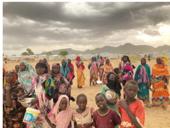
Des femmes et enfants réfugiés au nouveau camp d'Arkoum, dans le Ouaddaï à l'est du Tchad. Ils ont été relocalisés depuis la frontière vers le camp par le HCR et ses partenaires.

Depuis le début de l'urgence, plus de 349 800 réfugiés, retournés tchadiens et membres des communautés hôtes ont reçu une assistance humanitaire à l'est. Mais les besoins restent immenses, notamment en termes de protection, d'abris, d'articles de première nécessité, d'eau, de services d'hygiène et d'assainissement, de santé et d'assistance nutritionnelle. Le HCR et les partenaires continuent d'appeler à un plus grand soutien financier pour répondre aux besoins humanitaires urgents des personnes fuyant le conflit et sauver des vies.