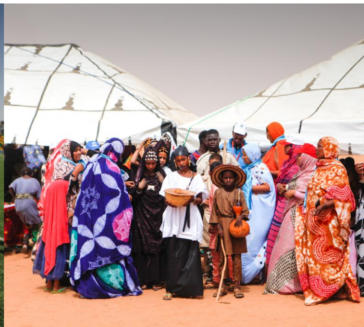
Mauritanie. Les réfugiés et les communautés hôtes célèbrent ensemble la Journée mondiale du réfugié à Nouakchott