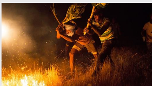
The Fire Brigade: Refugees Fight Against Climate Change

“Nous vivons des situations qui n'existaient pas il y a cinquante ou soixante ans. Tout se transforme et s'accélère. Vous pouvez voir la dégradation des terres, la désertification. Les problèmes sont là. Et ces populations vivent avec les problèmes du changement climatique chaque jour.”