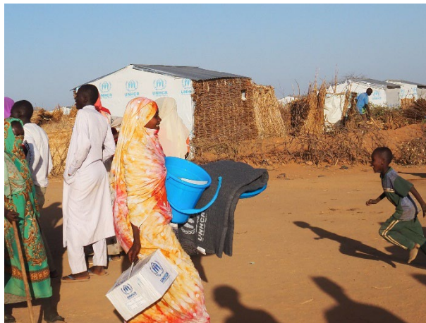
Distribution d'articles de première nécessité, notamment des couvertures, des ustensiles de cuisine et des lampes solaires aux réfugiés soudanais à Farchana.

Les autorités tchadiennes, le HCR et les partenaires continuent à travailler sans relâche pour relocaliser ces nouveaux réfugiés loin des frontières. A cette fin, 91 abris et 2 300 latrines ont été construits sur les 2 500 prévus. L'eau est désormais en quantité suffisante sur le site grâce à la réalisation de 5 puits positifs. En outre, des articles de première nécessité ont été prépositionnés à Alacha pour être distribués aux réfugiés à leur arrivée. Un premier convoi a déjà transporté environ 300 personnes vers le site le 30 novembre 2023.