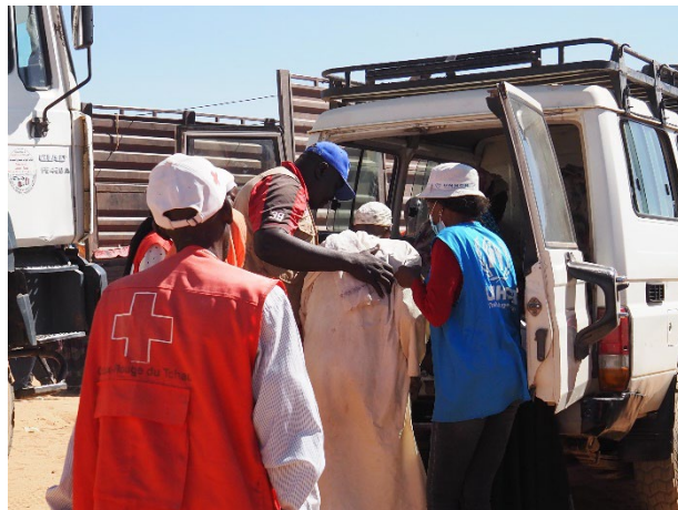
Une équipe du HCR et de la Croix Rouge Tchadienne aide une personne âgée à monter à bord d'un véhicule pour la relocalisation au nouveau site d'Alacha, à l'est du Tchad.

La relocalisation des réfugiés vers le nouveau site d'Alacha a commencé le 30 novembre 2023. La communauté d'accueil a réservé un accueil chaleureux aux réfugiés en leur offrant des repas chauds. A ce jour, 2 453 personnes y ont été relocalisées . Les réfugiés ont été logés dans de nouveaux abris. Les femmes enceintes et leurs enfants ont été transportés dans des ambulances pour recevoir des soins appropriés au cours du trajet.