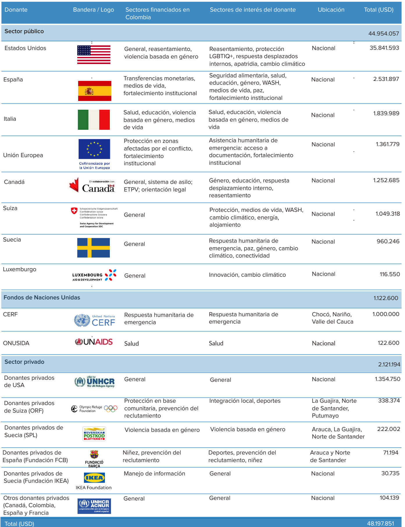
Tabla 1: Donantes de ACNUR Colombia (corte diciembre 2023)

ACNUR Colombia recibe la mayoría de sus recursos del sector público (93%), es decir de gobiernos de otros países. También recibe recursos del sector privado (4%) y, en menor medida, de otros Fondos de Naciones Unidas (2%).