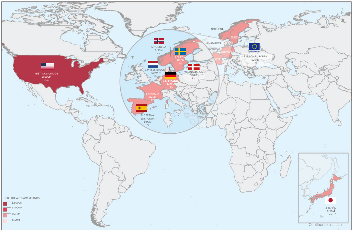
Mapa 1: TOP 10 donantes globales de ACNUR en 2023

1) A nivel global el mayor donante de ACNUR es Estados Unidos, seguido de Alemania y la Unión Europea. Además, otros donantes como Japón, Noruega, Suecia, Francia, donantes individuales de España, Dinamarca y Países Bajos están en el TOP 10.