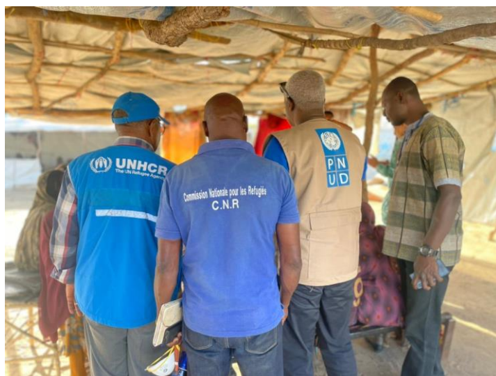
Visite du PNUD - RCA au centre d'enregistrement des réfugiés soudanais à Korsi.