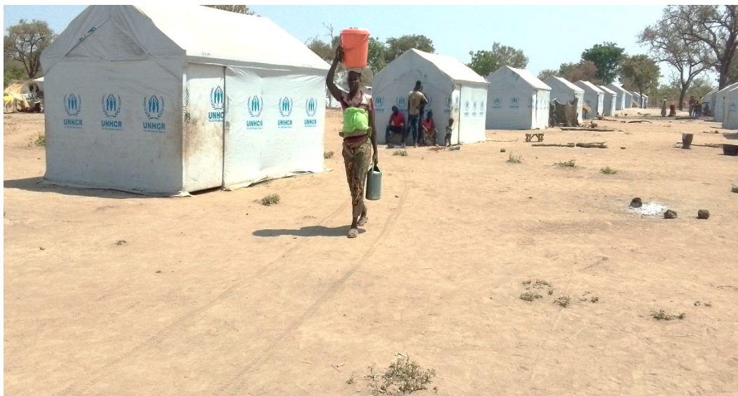
Une femme tchadienne porte un seau d'eau sur le site de Betoko.