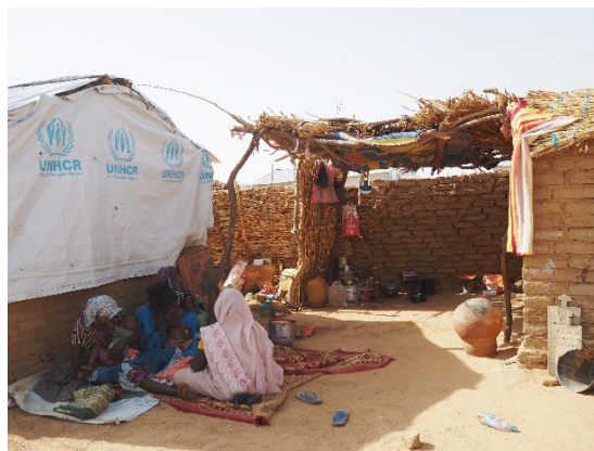
A Farchana, à l'est du Tchad, des réfugiés soudanais confectionnent des briques pour élargir et transformer leurs abris temporaires en bâche, en habitations en banco plus durables et mieux adaptées aux conditions climatiques.

Au Tchad, la moyenne des nouveaux arrivants soudanais par jour s'est élevée à plus de 600 au cours des quatre dernières semaines, pour un total de 18 947 personnes. La semaine dernière, 3 439 nouveaux arrivants (876 ménages) ont franchi la frontière, principalement aux points d'entrée d'Adré et d'Adikong, dans la province du Ouaddaï. Ce chiffre est légèrement supérieur à celui de la semaine précédente (3 262). Depuis avril 2023, 592 264 nouveaux arrivants ont été dénombrés au Tchad, dont 99 620 en 2024.