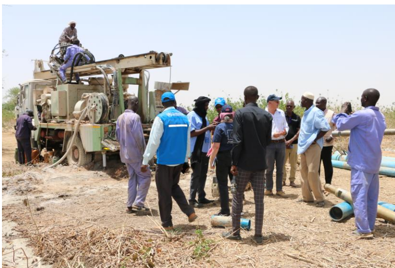
Forage d'un puits sur le nouveau site de réfugiés de Dougui