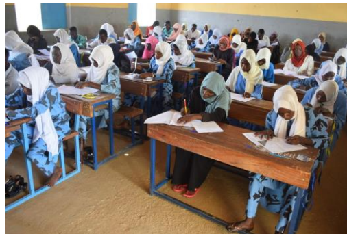
Des réfugiés Soudanais passant l'épreuve du baccalauréat à Farchana, à l'est du Tchad.

Le nombre d'arrivées de réfugiés soudanais augmente en juin par rapport aux trois mois précédents avec en moyenne 2 585 nouveaux arrivants par semaine. La Commission nationale d'accueil de réinsertion des réfugiés et des rapatriés (CNARR) et le HCR ont dénombré 849 nouveaux arrivants, en l'espace d'une semaine, à Tiné dans la province du Wadi Fira. La majorité de ces arrivants sont des femmes et des enfants, les hommes étant confrontés à de nombreux obstacles de la part des groupes armés sur les routes. Les nouveaux arrivants seront relocalisés à Touloum.