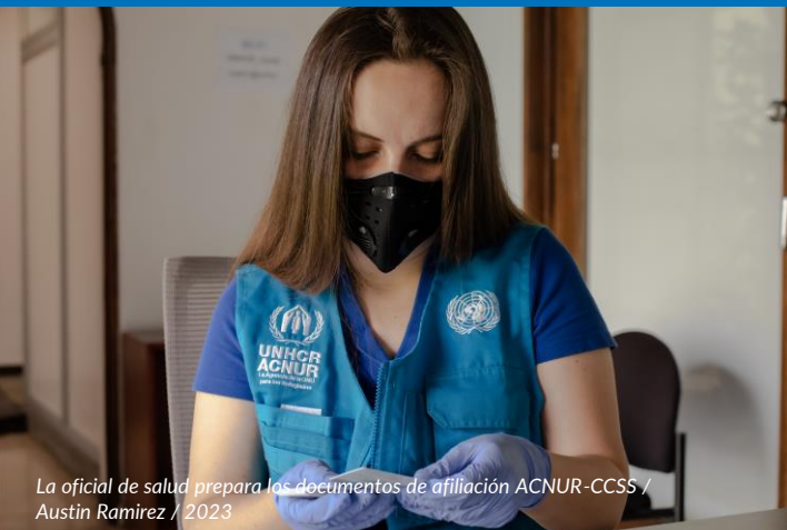
La oficial de salud prepara los documentos de afiliación ACNUR-CCSS / Austin Ramirez / 2023