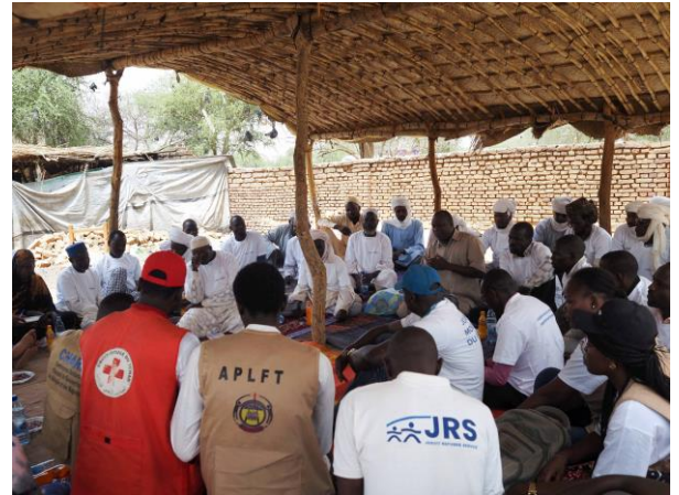
Le HCR et ses partenaires animant une séance de sensibilisation pour renforcer la cohésion sociale entre réfugiés et communautés hôtes à Farchana, à l'est du Tchad.

La Commission nationale d'accueil de réinsertion des réfugiés et des rapatriés (CNARR) et le HCR ont aidé à relocaliser 358 personnes (111 ménages) à Dougui, dans la province du Ouaddaï. Depuis le début du mois de juin, 2 935 réfugiés ont été relocalisés sur le site. Alors que les premières grosses pluies causent déjà des dommages matériels, les partenaires en appui au gouvernement et aux autorités locales multiplient les efforts pour accélérer les relocalisations vers Dougui. Le site peut accueillir jusqu'à 50,000 personnes.