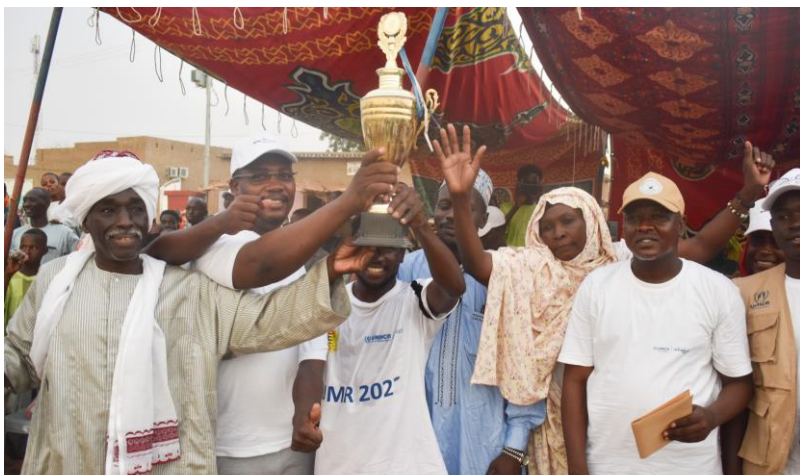
Les réfugiés ont remporté le match de football contre les Tchadiens lors de la Journée mondiale du réfugié