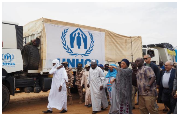
Mme Amina J Mohamed et la délégation à la frontière d'Adré