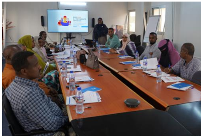
Les partenaires de mise en œuvre du HCR ont reçu une formation sur la Prévention de l'Exploitation et des Abus Sexuels (PSEA) au bureau du HCR à Djibouti-ville

Le HCR assiste à la 2ème session ordinaire du Parlement de Djibouti. Le 1er octobre, le Représentant du HCR a assisté à la deuxième session parlementaire ordinaire de 2024. La session, organisée par le président du Parlement, a été suivie par les membres du cabinet dirigés par le Premier ministre, les membres du Parlement, le corps diplomatique et les représentants des organisations internationales et des sociétés civiles. Le HCR a saisi cette occasion pour remercier le Président du Parlement, deuxième personnalité du pays, pour son leadership et pour tout le travail que le Parlement accomplit concernant les lois sur les réfugiés. Le Premier ministre a également demandé aux membres des missions diplomatiques et aux représentants des Nations Unies de soutenir et de défendre la candidature de Djibouti au poste de président de l'Union africaine, où Djibouti est représenté par son ministre des Affaires étrangères, S.E. Mahamoud Ali Youssouf.