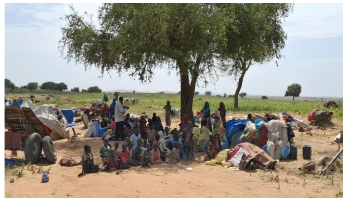
Nouveaux arrivants soudanais à Birak, Province de Wadi-Fira