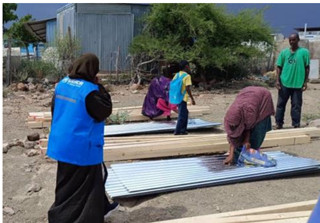
Le HCR fournit des tôles et des chevrons à 55 familles réfugiées dans le village d'Ali-Addeh pour reconstruire leurs abris

Le HCR s'entretient avec le Ministre des Affaires Sociales et de la Solidarité. Le 08 octobre 2024, le Représentant du HCR a tenu une réunion avec la Ministre des Affaires Sociales et de la Solidarité (MASS), SE Mme Ouloufa Ismail Abdo. Les discussions ont porté sur les domaines d'intérêts communs qui peuvent faciliter l'intégration effective des réfugiés et assurer leur protection sociale. Dans le passé, le HCR et le MASS ont collaboré sur plusieurs activités, y compris l'inclusion des réfugiés dans le régime national d'assurance médicale, le registre social national, le profilage des réfugiés et l'assistance pour les réfugiés urbains vulnérables.