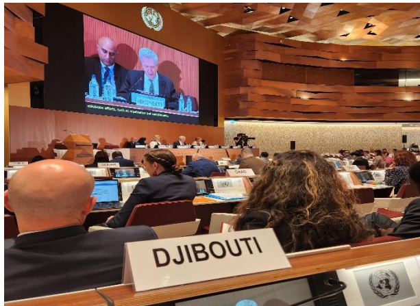
Djibouti a participé à la 75 ème session du comité exécutif du HCR