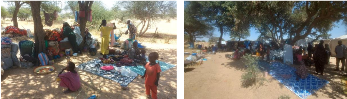
Photos des nouveaux arrivants à Koulbus au Tchad

Depuis le début du mois, près de 49 000 personnes fuyant les violences ont traversé la frontière au point d'entrée de Birak, Koulbous et Tiné, dans le Wadi Fira. La grande majorité des nouveaux arrivants sont des femmes et des enfants. Ils ont trouvé abris sous les arbres. Beaucoup ont survécus à des violences atroces. Parmi eux 10 blessés ont été pris en charge par le centre de santé de Koulbous. Une mère allaitante et son bébé de quatre mois sont décédés au centre des suites de leur blessures.