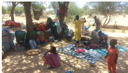
Photos des nouveaux arrivants installés sous les arbres à Koulbous et Tiné, Wadi Fira, à l'est du Tchad.

Depuis le début du mois, près de 49 000 personnes fuyant les violences ont traversé la frontière au point d'entrée de Birak, Koulbous et Tiné, dans le Wadi Fira. La grande majorité des nouveaux arrivants sont des femmes et des enfants. Ils ont trouvé abris sous les arbres. Beaucoup ont survécus à des violences atroces. Parmi eux 10 blessés ont été pris en charge par le centre de santé de Koulbous. Une mère allaitante et son bébé de quatre mois sont décédés au centre des suites de leur blessures.