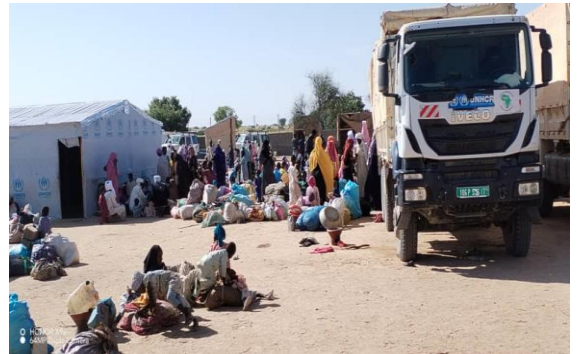
Relocalisation des nouveaux arrivants de Tiné vers le site aménagé de Milé, Wida Fira, à l'est du Tchad.

Le HCR et ses partenaires reprennent la relocalisation des nouveaux arrivants du site spontané d'Adré vers le site aménagé de Dougui, province de Ouaddai. Le 29 octobre 2024, le HCR et ses partenaires ont relocalisé 154 personnes vers Dougui, le sixième site aménagé construit pour accueillir les réfugiés fuyant le Soudan. Les relocalisations avaient été suspendues car les pluies diluviennes avaient rendu les routes inaccessibles aux camions.