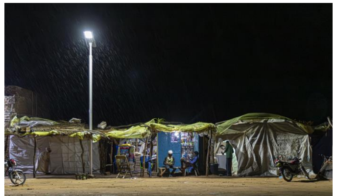
Le HCR installe des lampadaires solaires pour assurer la protection des réfugiés la nuit et améliorer les activités de subsistance à Zabout