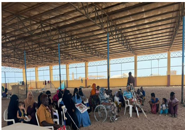
Au village de réfugiés de Markazi, les réfugiés vivant avec handicap ont été enregistrés

Le gouvernement djiboutien poursuit l'enregistrement des réfugiés vivant avec handicap dans le système national. Au cours de la semaine, le gouvernement djiboutien à travers l'Agence Nationale pour les Personnes vivant avec Handicap (ANPH) a poursuivi l'enregistrement au système national des réfugiés vivant avec un handicap résidant dans les villages de réfugiés. Environ 49 réfugiés vivant avec handicap ont déjà été enregistrés dans la ville de Djibouti et dans le village de réfugiés de Markazi, l'exercice est toujours en cours pour couvrir tous les villages des réfugiés. Les types d'handicaps enregistrés jusqu'à présent sont les déficiences mentales, auditives, physiques et visuelles. Les codes de vulnérabilité ont été automatiquement attribués dans la base de données du HCR (PROGRES) pour toutes les personnes enregistrées par l'ANPH.