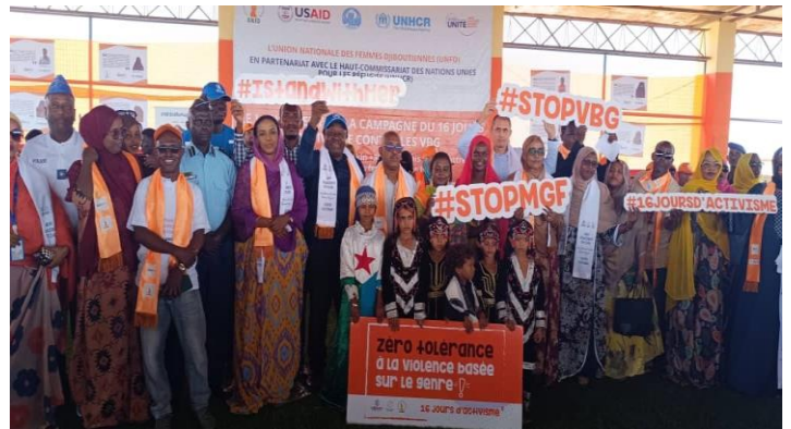
Le HCR et partenaires lancent les 16 jours d'activisme contre les VBG

Le HCR et ses partenaires lancent la campagne des 16 jours d'activisme contre les violences sexistes. Le 25 novembre, le HCR, en collaboration avec l'Union nationale des femmes djiboutiennes (UNFD), a lancé la campagne « Tous UNiS contre la violence sexiste », qui durera 16 jours du 25 novembre au 10 décembre. Le lancement de la campagne a eu lieu dans le village de réfugiés de Markazi, en présence des représentants du gouvernement, les autorités locales, les agences des Nations unies, les réfugiés et d'autres partenaires humanitaires. Tous les partenaires se sont convenus de la nécessité d'une collaboration active pour promouvoir l'autonomisation des femmes et renforcer les initiatives locales. Le HCR a délivré des certificats aux comités de réfugiés qui soutiennent la lutte contre la violence sexuelle et sexiste, illustrant ainsi la reconnaissance de leur engagement et de leur rôle actif dans la transformation de leurs communautés.