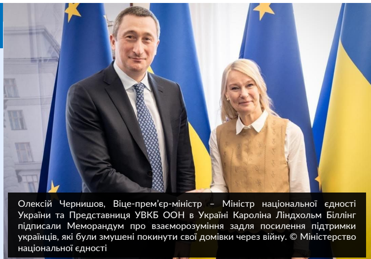
Олексій Чернишов, Віце-прем'єр-міністр – Міністр національної єдності України та Представниця УВКБ ООН в Україні Кароліна Ліндхольм Біллінг підписали Меморандум про взаєморозуміння задля посилення підтримки українців, які були змушені покинути свої домівки через війну.

В рамках цього Меморандуму УВКБ ООН зобов'язується ділитися своїм досвідом та експертизою щодо добровільного повернення біженців і пошуку довгострокових рішень для них, а також розширювати підтримку в цих напрямках. Докладніше читайте тут .