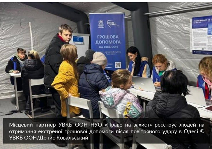
Місцевий партнер УВКБ ООН НУО «Право на захист» реєструє людей на отримання екстреної грошової допомоги після повітряного удару в Одесі.