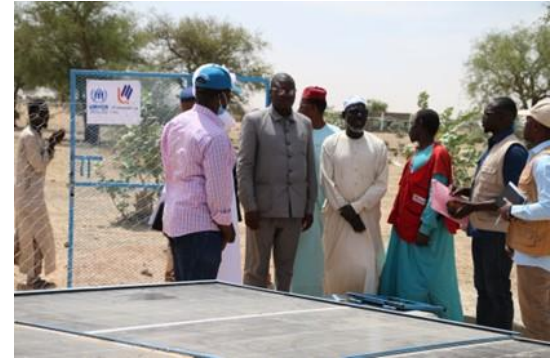
Réception d'un forage solaire en faveur des réfugiés et population hôte d'Abougoudam réalisé par le HCR en partenariat avec LMI

Le Haut Commissariat des Nations Unies pour les réfugiés et les autorités tchadiennes cherchent à offrir des solutions durables et intégrées aux réfugiés à travers les villes et les villages afin de compléter la relocalisation vers des sites aménagés. Cette stratégie vise à accélérer le processus de relocalisation hors de la frontière, à rechercher des alternatives aux sites et à produire un impact plus durable pour les réfugiés et les communautés d'accueil en termes de résilience et de développement local. Arné, à proximité de la ville de Guereda, dans la province de Wadi Fira, a été sélectionné comme site pilote. Situé à seulement 500 mètres des infrastructures de base, telles que le centre de santé et l'école secondaire de la ville, il peut accueillir plus de 10 000 personnes et est susceptible d'être agrandi. Si le site pilote est un succès, cela pourrait encourager les partenaires de développement à investir dans ces villes pour soutenir les efforts de la relocalisation..