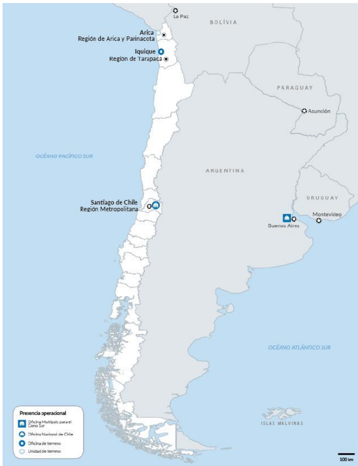
La Oficina Regional de ACNUR para el Sur de América Latina cubre las operaciones en Argentina, Bolivia, Chile, Paraguay y Uruguay. Tiene su sede en Buenos Aires, Argentina.

ACNUR continúa trabajando en el fortalecimiento de alianzas estratégicas con el sector público y privado, para brindar asistencia, protección y soluciones , así como generar herramientas para empoderar a las personas con necesidades de protección internacional en su camino hacia una integración socioeconómica real y efectiva .