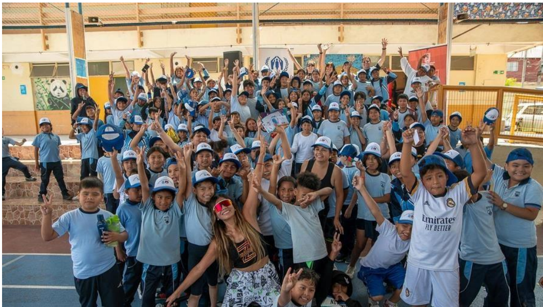
La actividad realizada para el término del año escolar en la Escuela Centenario de Iquique tuvo por objetivo la valoración de la diversidad, fomentar la multiculturalidad y estrechar los lazos entre los miembros de la escuela, que posee un alto porcentaje de matrícula extranjera.