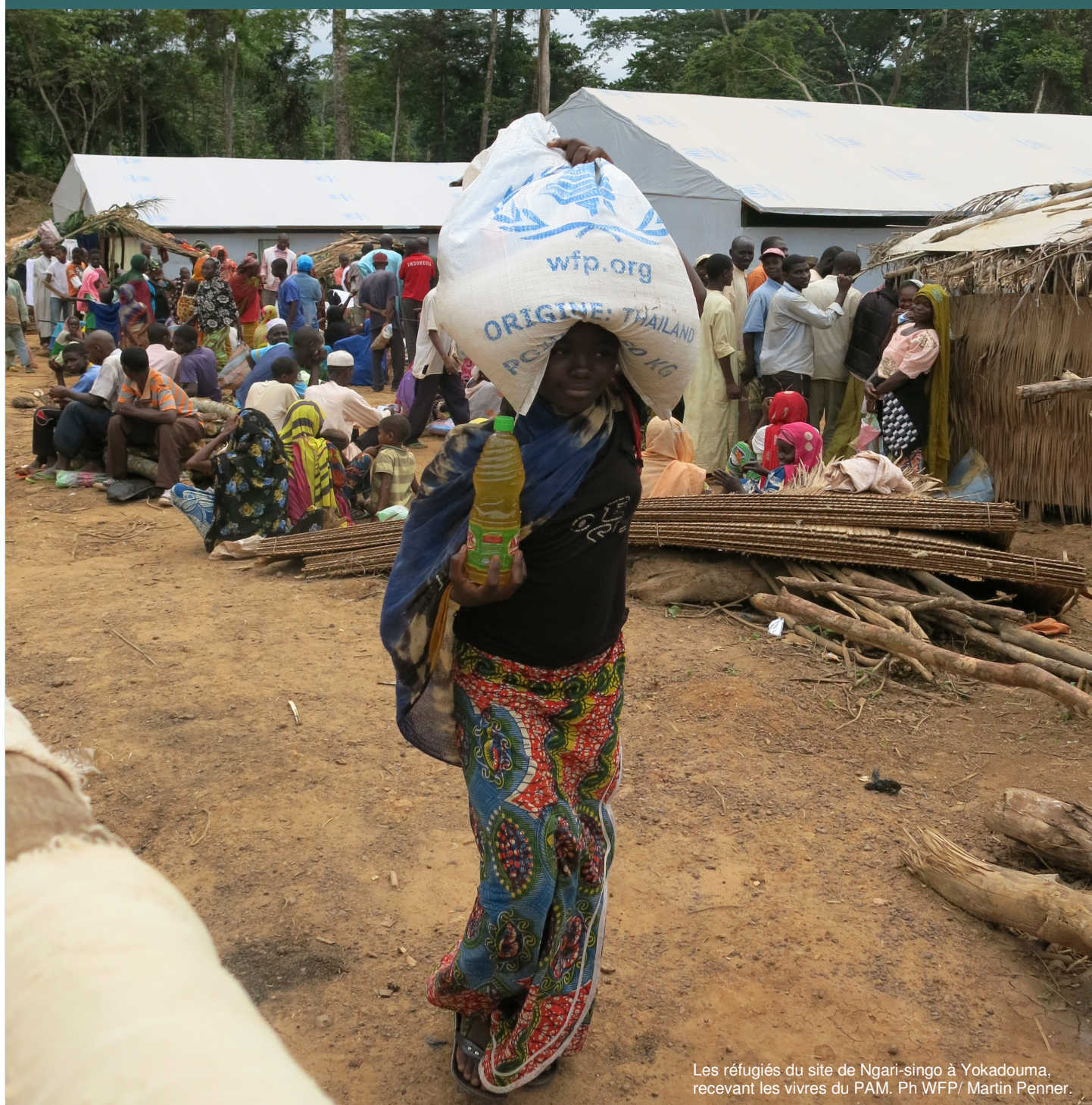
Les réfugiés du site de Ngari-singo à Yokadouma, recevant les vivres du PAM.