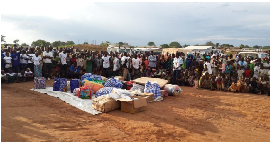
Cérémonie de remise des dons du personnel des Nations Unies aux réfugiés et populations locales de Timangolo.