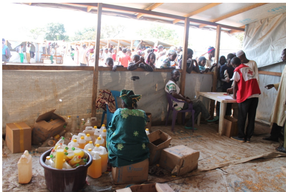
Distribution des vivres du PAM par les équipes de la FICR au site de Gado.