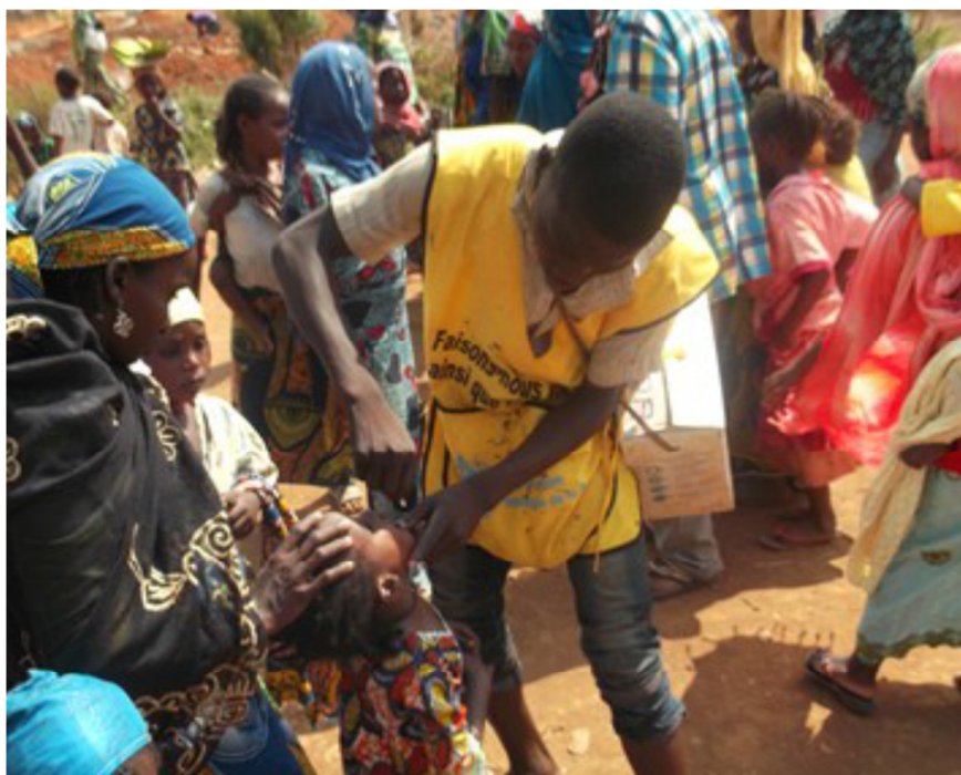
Vaccination contre la polio au point d'entrée de Gbity.

Nouveaux arrivés à Kentzou: Le 10 décembre, 23 personnes, représentant 6 ménages, sont arrivées à Kentzou dans la région de l'Est en provenance de l'Eglise Sainte Anne de Berberati, en RCA où elles avaient trouvé refuge depuis 6 à 7 mois, espérant que la situation s'améliore afin qu'elle puisse regagner leurs villages. D'après ces nouveaux arrivés, la dégradation continue de la situation sécuritaire en RCA les a poussés à quitter Berberati pour le Cameroun. Ces personnes sont arrivées à bord de deux véhicules conduits par l'Evêque de Berberati et son équipe. L'équipe du HCR a identifié 8 camerounais parmi ces personnes, et procédera à l'enregistrement des autres. AHA et FICR, partenaires du HCR, ont respectivement fait un screening médical de ces personnes et une distribution de biscuits vitaminés. Depuis le mois d'octobre 2014, le HCR n'avait plus enregistré de nouveaux arrivés en provenance de la RCA.