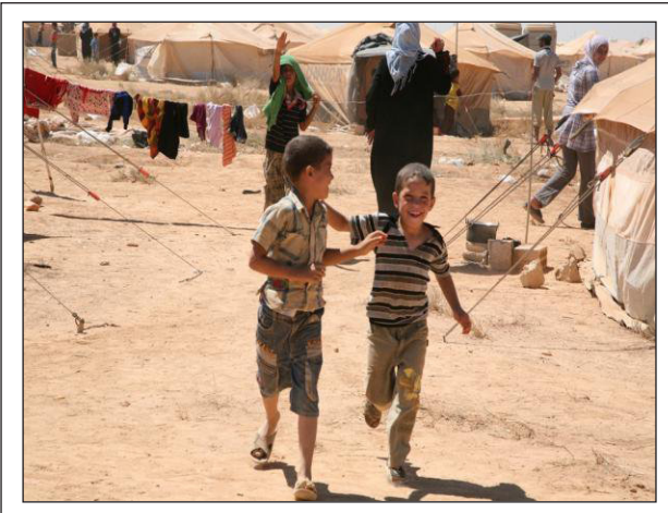
أطفال لاجئون سوريون في مخيم الزعتري