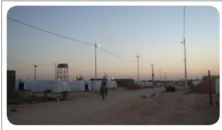
جانب من مخيم القوائم للاجئين