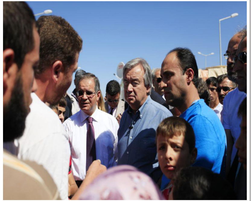
المفوض السامي السيد أنطونيو غوتيريس يلتقي اللاجئين السوريين أثناء زيارته إلى أحد مخيمات اللاجئين في تركيا