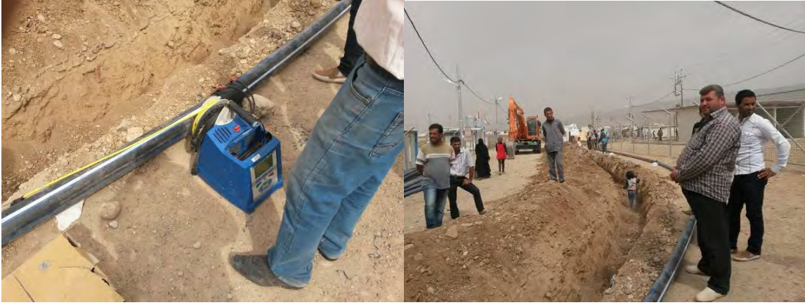
إنشاء شبكة الماء المؤقتة من قبل (ACF) في مخيم باسبرما/ مفوضية اللاجئين