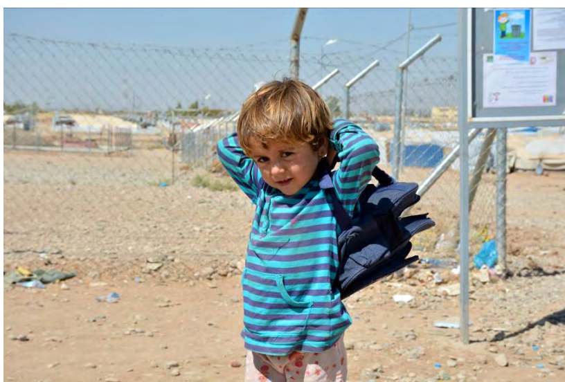
طفل سوري يغادر صفه الدراسي في مخيم قوشتابا للاجئين