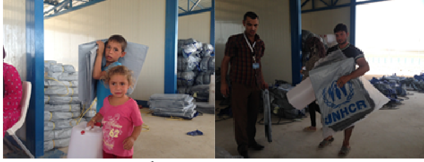
توزيع مواد للاستعداد لفصل الشتاء/ مفوضية اللاجئين