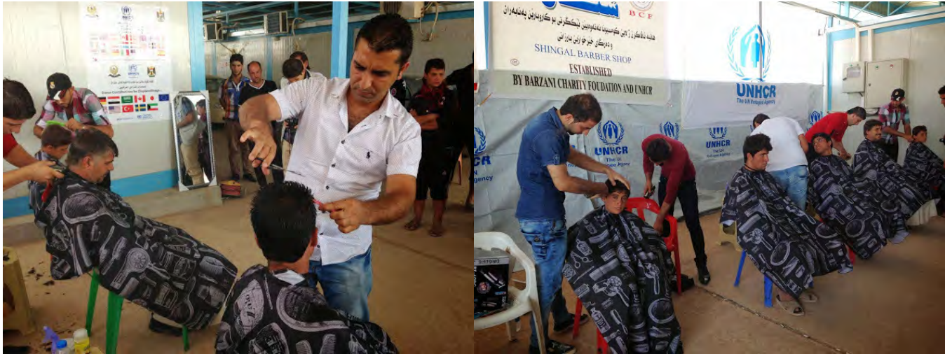
محل حلاقة اللاجئين لمتطوعي مخيم دوميز في مخيم باجت كاندالا للأشخاص النازحين/ مفوضية اللاجئين

لقد أقام الشباب محلاً للحلاقة مرتجلاً في باجت كانداله وكانت هناك طوابير تنتظر دورها طويلاً.