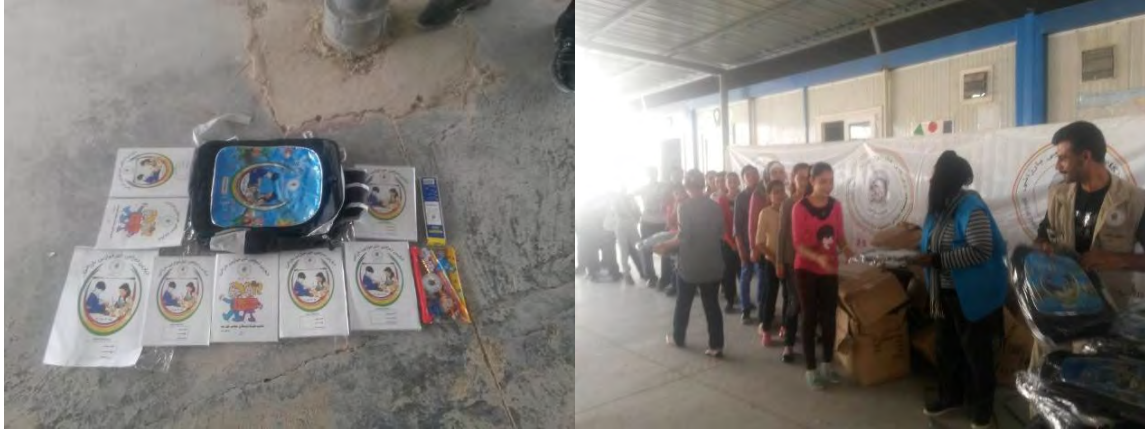
توزيع مؤسسة بارزاني الخيرية للحقائب المدرسية في مخيم قوشتابا/ مفوضية اللاجئين