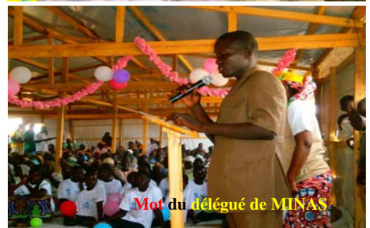
Mot du délégué de MINAS