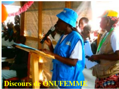
Discours de UNFEMME