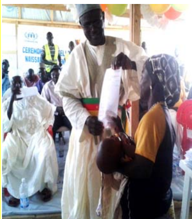
Remise officielle du premier acte de naissance par le Maire de Mokolo.

Dans l'optique de lutter contre l'apatridie, le 18 Novembre 2014 dans le camp des réfugiés de Minawao, le Maire de Mokolo a procédé à la remise officielle des 235 actes de naissance aux enfants Nigériens qui sont nés dans le camp en territoire Camerounais. Le Maire de Mokolo a salué la collaboration existante entre IEDA Relief et l'UNHCR, pour les démarches entreprises en vue de l'obtention de ces derniers auprès du Gouvernement. Mais aussi la collaboration avec les autres partenaires du Camp de Minawao comme l'OMS, IMC, ALDEPA, etc. travaillant jours et nuit pour la protection des réfugiés Nigériens.