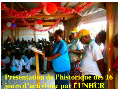
Présentation de l'historique des 16 jours d'activisme par l'UNHCR