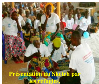
Présentation du Sketch par les réfugiés.