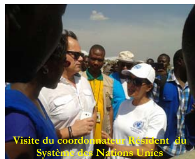
Visite du coordonnateur Résident du Système des Nations Unies