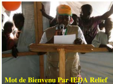
Mot de Bienvenu Par IEDA Relief