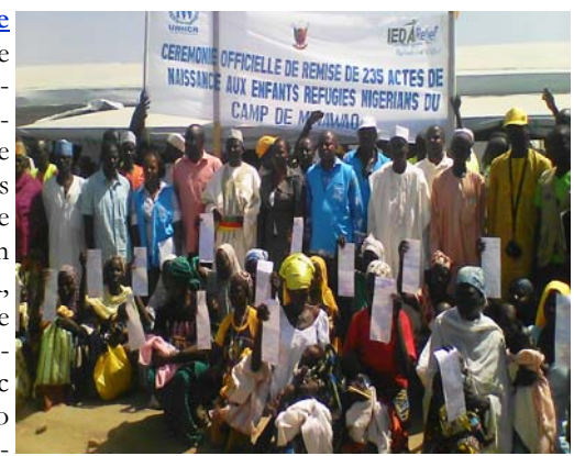
Photo de famille avec les bénéficiaires des 235 actes de naissance