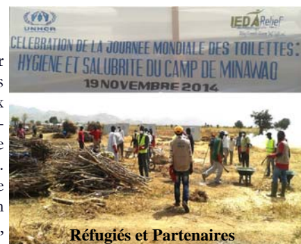
Réfugiés et Partenaires

camp de Minawao de militer pour obtenir une égalité d'accès aux toilettes pour les femmes, des aménagements spéciaux pour les personnes handicapées, et organiser des journées de salubrité dans le camp et dans les villages environnants. IEDA Relief s'est chargé de la logistique de cette journée et a mis à la disposition des partenaires et des réfugiés: les pelles, les râtaux, les brouettes, les Coupe-coupe, les Cache-nez, etc.