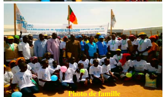
Photo de famille