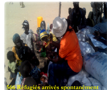
566 Réfugiés arrivés spontanément

Le camp de Minawao a reçu la visite des plusieurs personnalités durant le mois de novembre: Mme le Haut commissaire du Nigeria au Cameroun, le Coordinateur Résident du système de nations unies et des Chefs d'Agences (OMS, UNICEF, UNFPA, UNHCR et PAM), le Représentant Adjoint de l'UNICEF, les médias : AFP, CCTV, BBC, CRTV.