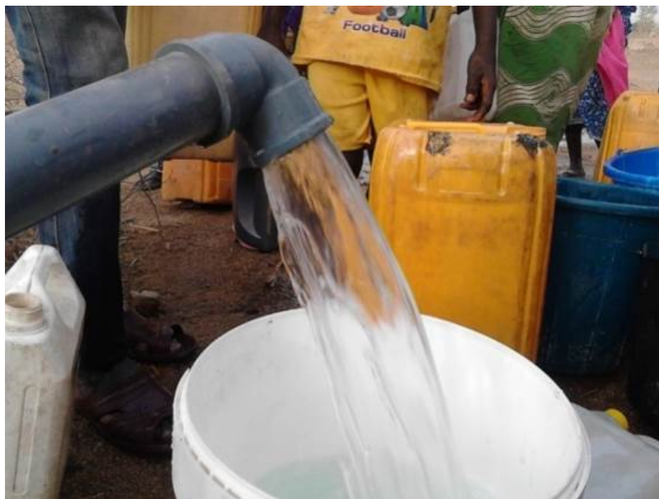
Essai de pompage de l'un des 10 forages nouvellement construits par le HCR dans les camps de Minawao et Gawar.